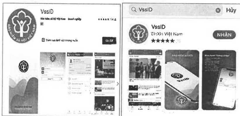
Hình ảnh: Ứng dụng VssID trên Google Play/CH Play/Appstore

Bước 2: Tải VssID từ kho ứng dụng Google Play/CH Play (hệ điều hành Android) hoặc AppStore (hệ điều hành IOS) về điện thoại.