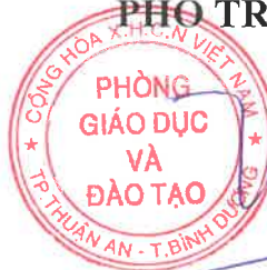
Đỗ Huỳnh Kiều